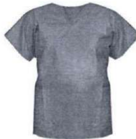
Fig.1: Chaqueta descartable (no incluye diseño)