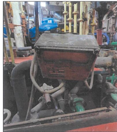
Imagen de contador de agua (D).