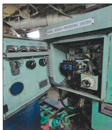
Imagen de tablero eléctrico (B).