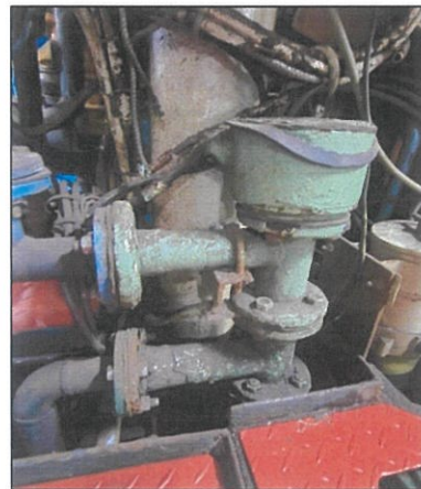
Imagen de alojamiento de los ánodos titanio (G).