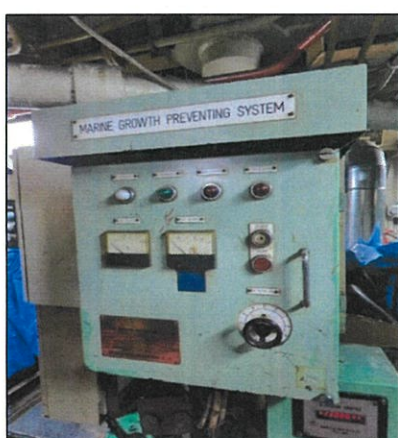
Imagen de tablero eléctrico (A).