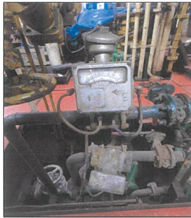
Imagen de contador de agua (C).

“Decenio de la Igualdad de Oportunidades para mujeres y hombres” “Año de la recuperación y consolidación de la economía peruana”