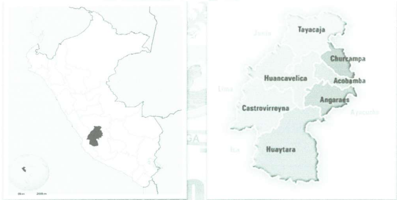
Gráfico N° 02: Macro Localización Nivel Provincial – Distrital