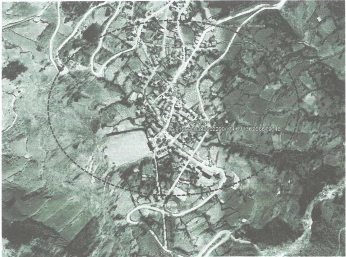
Gráfico N° 03: Micro Localización del Área de Estudio