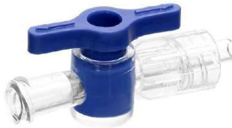
Fig. 1: Llave de doble vía (imagen referencial, no incluye el diseño)