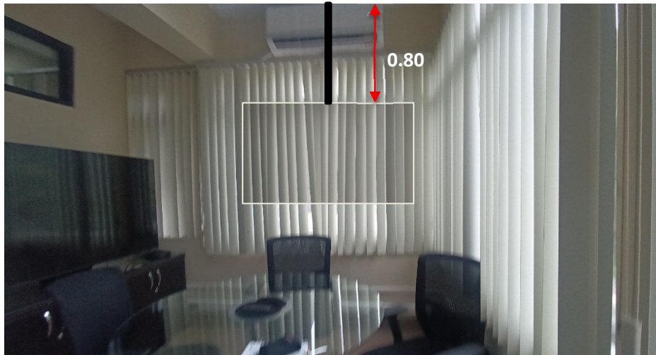
Imagen 2. Ubicación de rack de techo