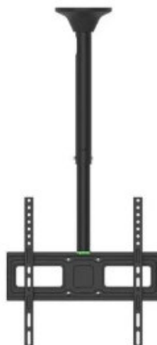
Imagen 1. Referencial. Rack de techo

Rack anclado desde el techo (losa aligerada)