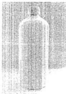
Fig. 1.: (Diseño de referencia).