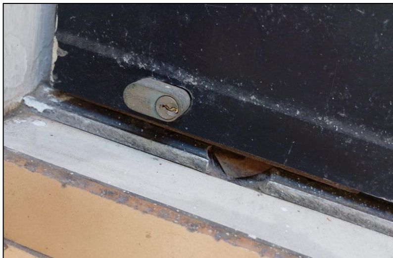
- Ilustración 3: Chapa y riel de las puertas de mampara