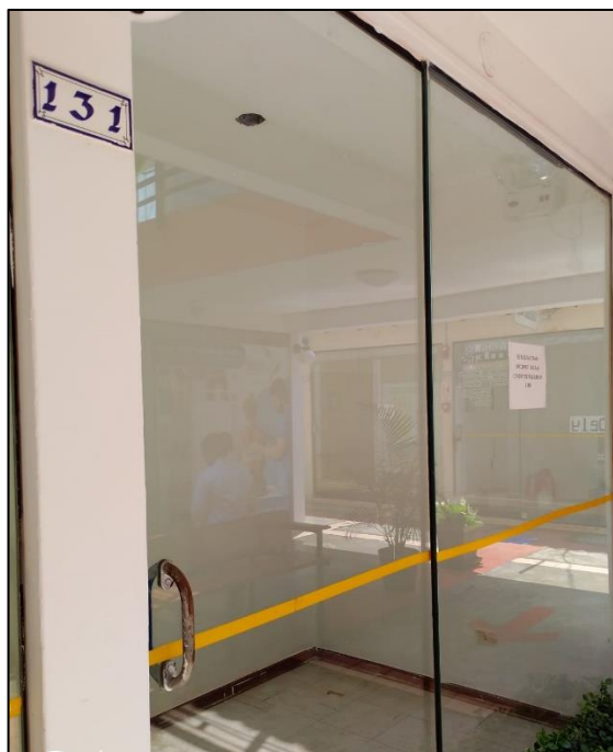
- Ilustración 1: Imagen de los stands con puertas de mampara