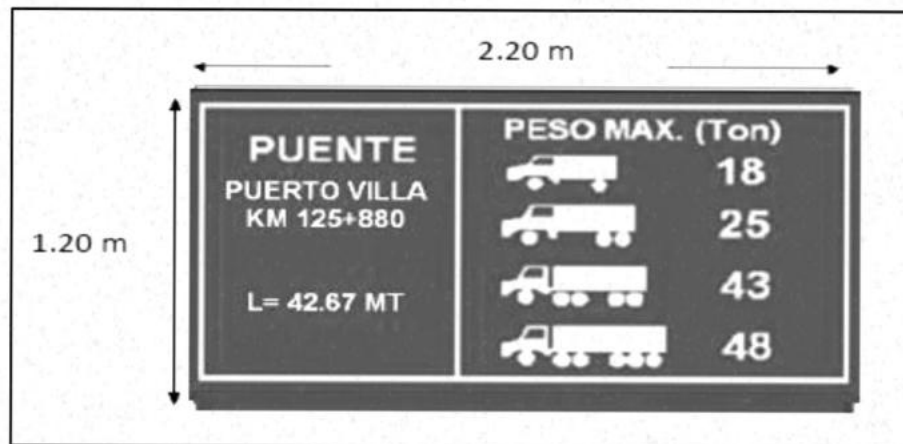
Imagen 01 – Acotación del panel informativo de puente