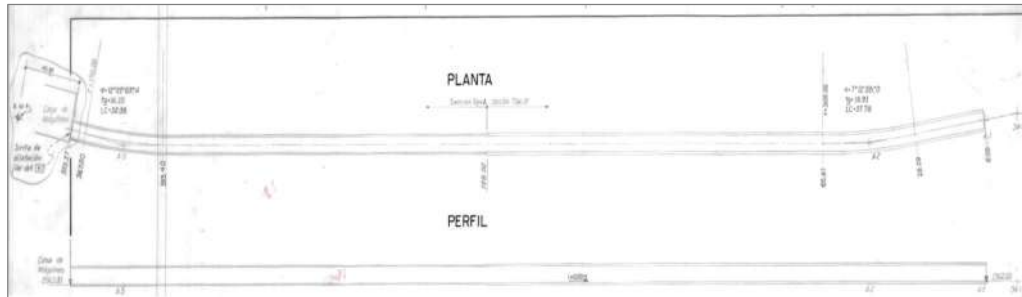
Imagen N° 1: Vista en planta y perfil del túnel de acceso hacia la Casa de Máquinas de la Central Hidroeléctrica de Charcani V.