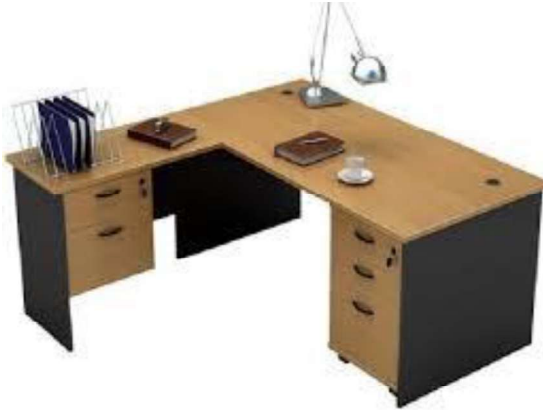
Imagen N° 03: Imagen referencial de escritorio

“Año del Bicentenario, de la consolidación de nuestra Independencia, y de la conmemoración de las heroicas batallas de Junín y Ayacucho”