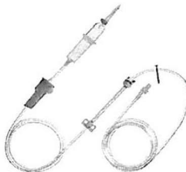
Fig. 1.: Línea para Bomba de Infusión sin Volutrol (No implica diseño)