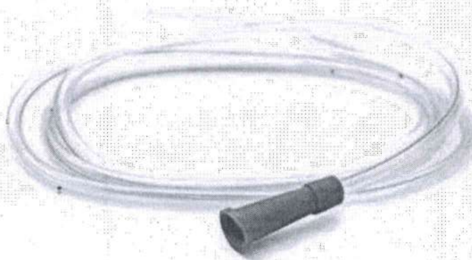
Fig. 1: Sonda nasogástrica (imagen referencial, no incluye el diseño)