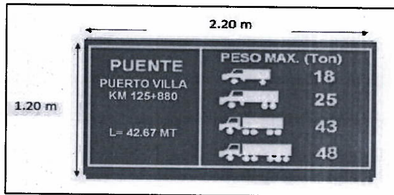
Imagen 01 – Acotación del panel informativo de puente