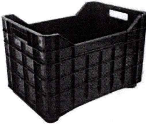
BANDEJA HORTICOLA GERMINADORA