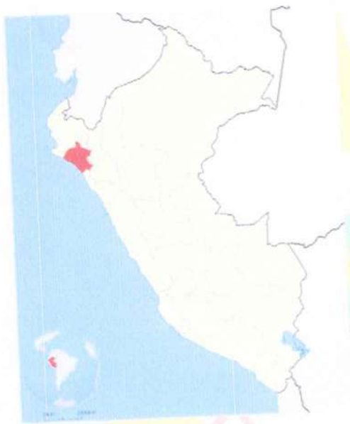
PROVINCIA DE LAMBAYEQUE