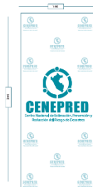
Banner Roll Up