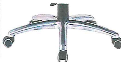
BALEROS DE GRAN CALIDAD