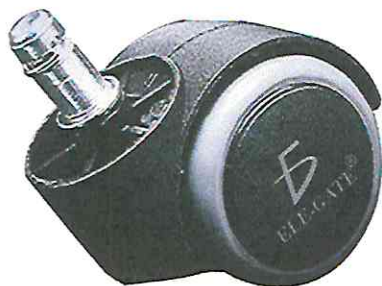
LLANTAS SUPER RESISTENTE