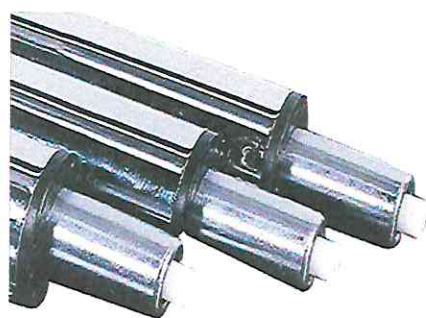
SISTEMA DE GAS HIDRAULICO