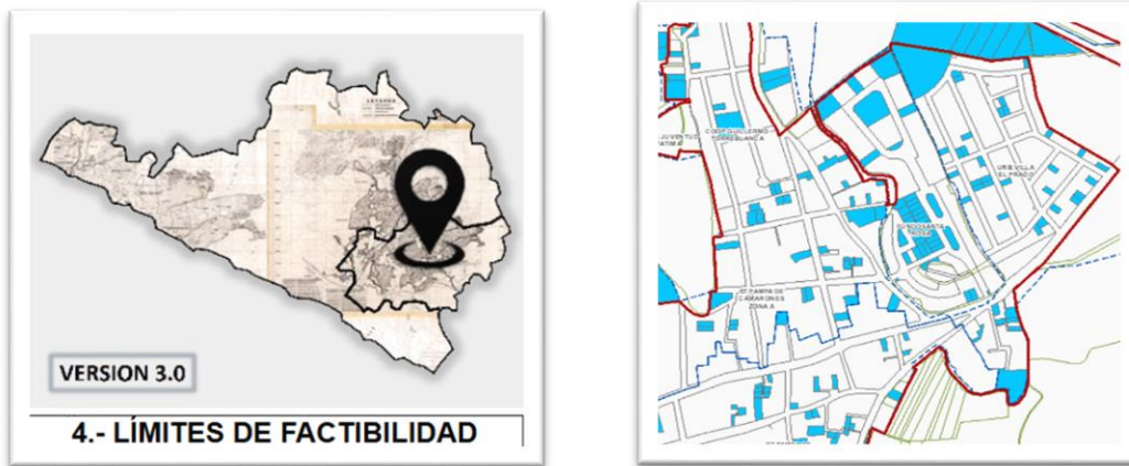
Imagen No. 01: Vista de información publicada de los Límites de Factibilidad