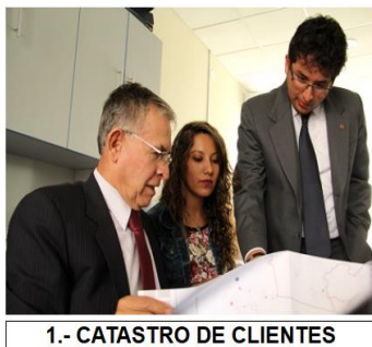
1.- CATASTRO DE CLIENTES

En la plataforma SEDAMAP, se tienen que lograr mantener actualizado oportunamente las cartografías, toda vez que esto facilita las tareas de contratación de nuevos servicios, por lo que es importante mantenerlo al día, pero por el volumen incrementado de expedientes que se vienen dando genera que se incremente el nro. de expedientes que están pendientes de dibujar en el SEDAMAP.