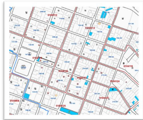
Imagen No. 02: Cartografía del SEDAMAP

A efectos de lograr poner al día oportunamente esta sobrecarga de trabajo que comprende a nivel del catastro comercial se tienen una proyección de la implantación de 405 expedientes nuevos de dibujo y el control de calidad pendiente de 888 expedientes, acción que permita dar la confiabilidad de la información del catastro comercial.