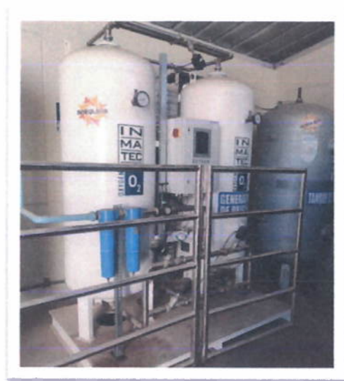
Generador de Oxígeno

GOBIERNO REGIONAL DE AREQUIPA GERENCIA REGIONAL DE SALUD HOSPITAL CENTRAL DE MAJES