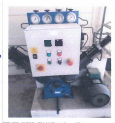
Compresor de llenado (Booster)