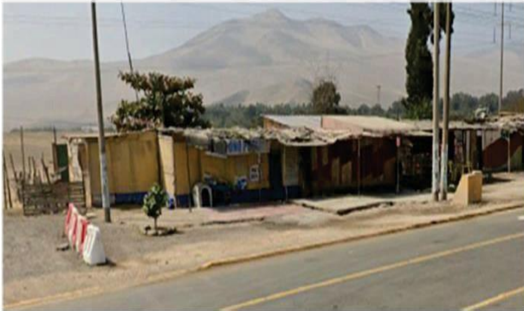
Fotografía 2. Ocupación de viviendas y locales comerciales de terceros, y a la derecha, caseta de SERPAR (caseta celeste) que no será materia de desocupación.