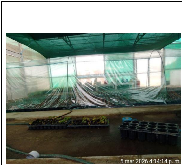
Fotografía 2: Vista interna del vivero