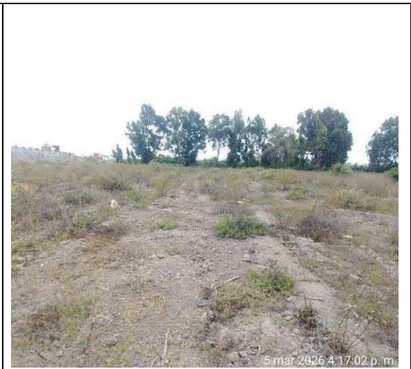
Fotografía 3: Área destinada para siembra definitiva de plantas