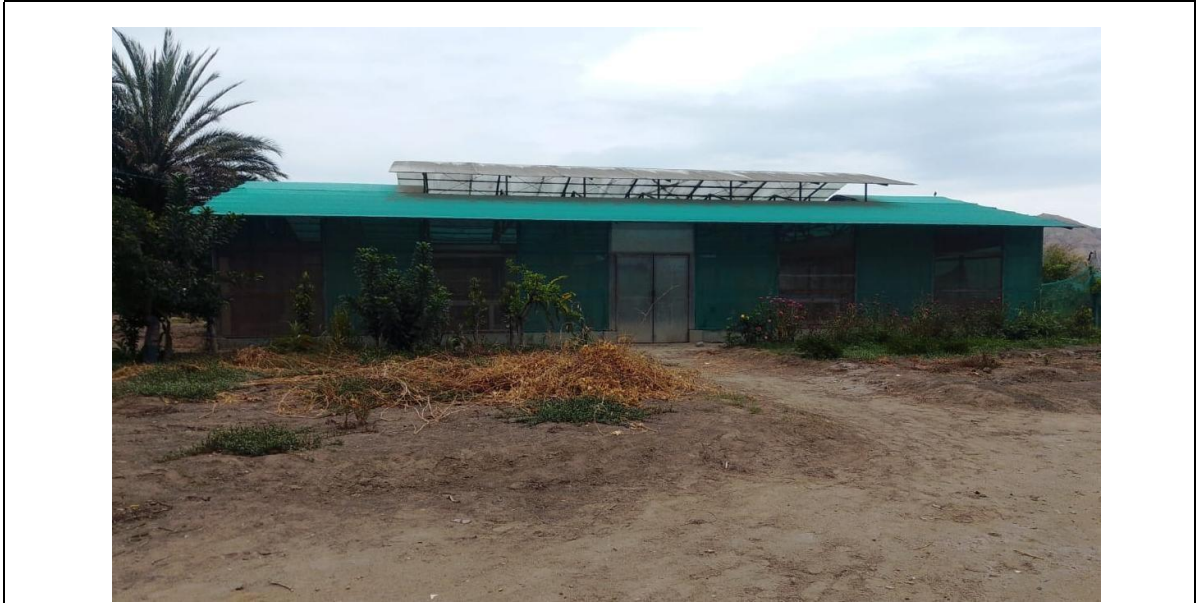
Fotografía 1: Vista frontal de vivero de propagación de plantas