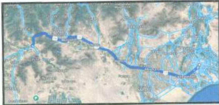
IMAGEN N°02: Recorrido de acceso Cercado de Chiclayo - Distrito de Olmos