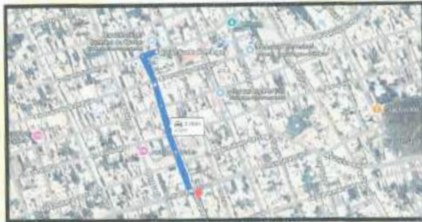
IMAGEN N°03: Recorrido de acceso de Centro Olmos - Centro de Salud Olmos