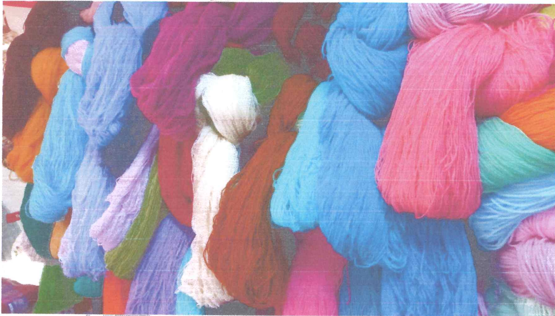
Imagen referencial :