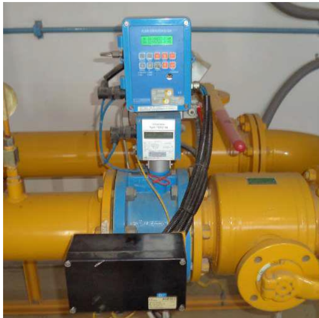
Imagen 2: Medidor de flujo de la CT Independencia