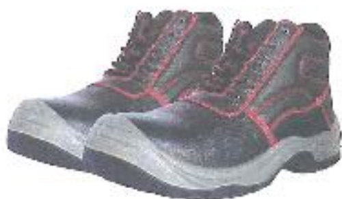
ZAPATOS DE SEGURIDAD TRABAJO – SEGURIDAD