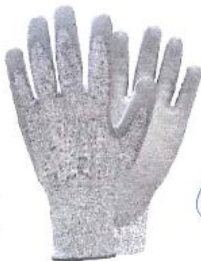
GUANTES DE TRABAJO