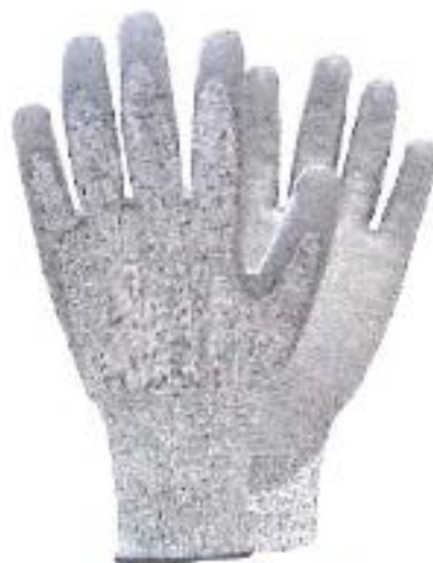
GUANTES DE TRABAJO