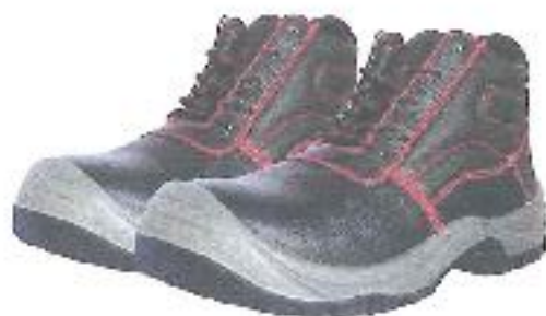
ZAPATOS DE SEGURIDAD TRABAJO SEGURIDAD