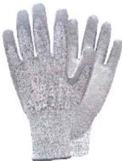
GUANTES DE TRABAJO

INSTITUTO DE VIALIDAD MUNICIPAL DE LA PROVINCIA DE CAJABAMBA