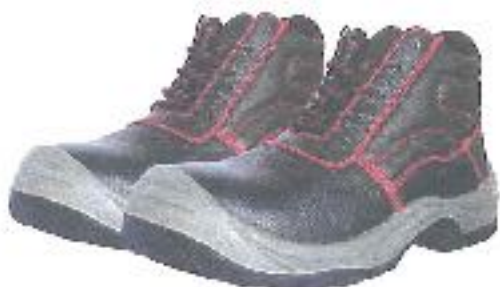
ZAPATOS DE SEGURIDAD TRABAJO – SEGURIDAD