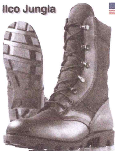
BORCEGUÍES COLOR NEGRO