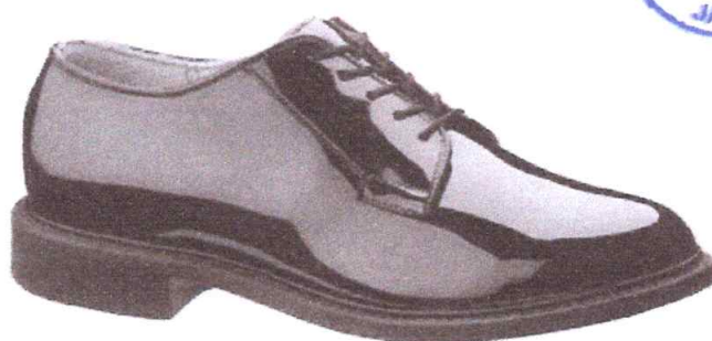
ZAPATO CHAROL CORFAN COLOR NEGRO