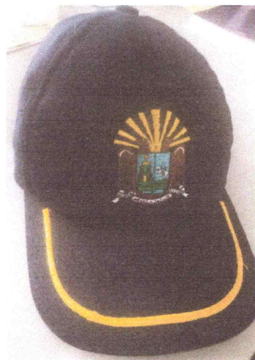
GORRA DRILL COLOR AZUL NOCHE