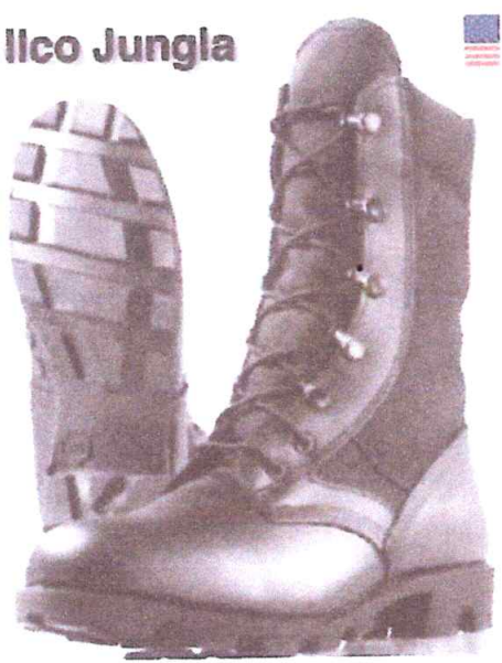
BORCEGUÍES COLOR NEGRO