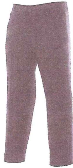
PANTALÓN DE VESTIR