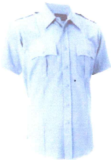
CAMISA MODELO COMANDO