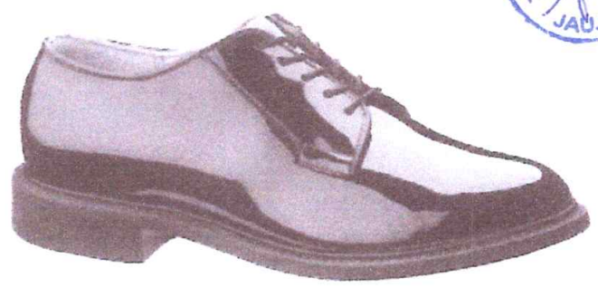
ZAPATO CHAROL CORFAN COLOR NEGRO