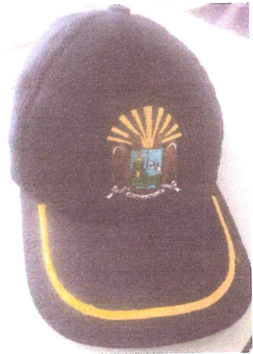
GORRA DRILL COLOR AZUL NOCHE