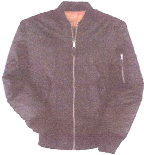
CASACA COMANDO MODELO AVIADOR