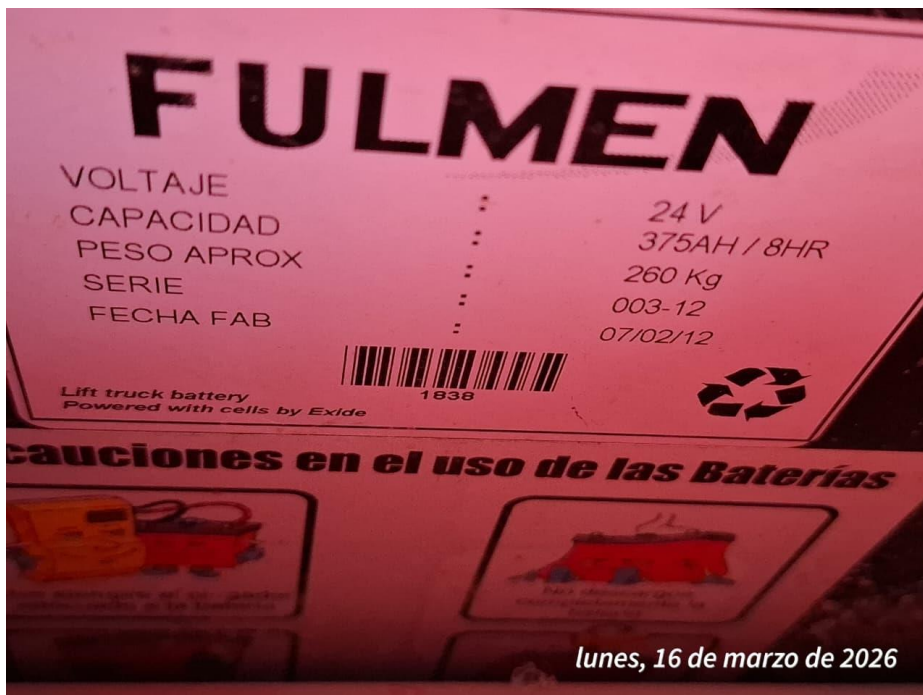
lunes, 16 de marzo de 2026