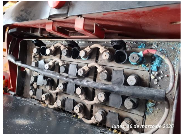
lunes, 16 de marzo de 2026