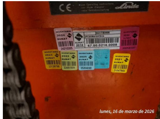
lunes, 16 de marzo de 2026