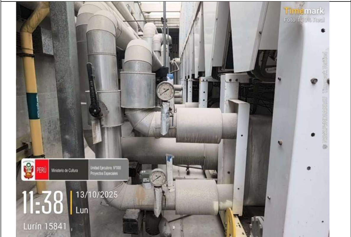
Imagen N° 04: Equipo Chiller's CH01.01