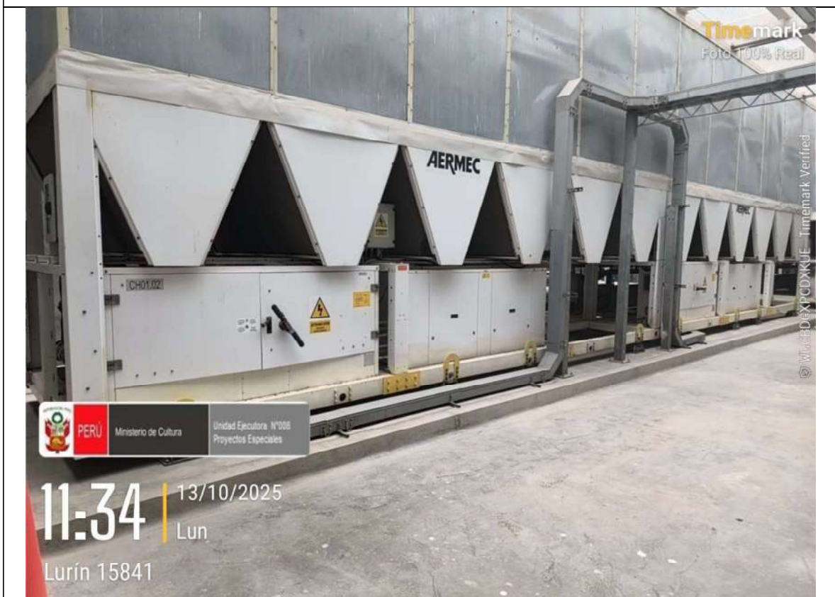
Imagen N° 06: Equipo Chiller's CH01.02