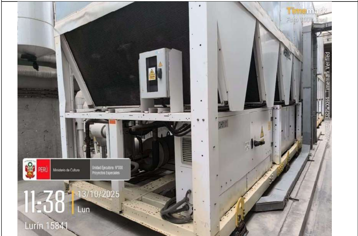
Imagen N° 02: Equipo Chiller's CH01.01