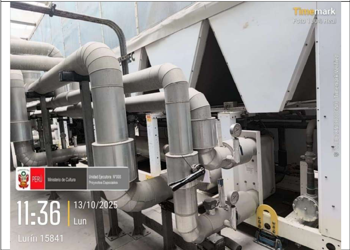
Imagen N° 08: Equipo Chiller's CH01.02