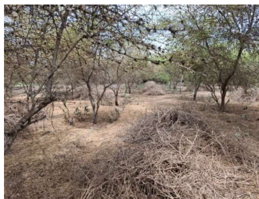
Fotografía 6: Parcela de algarrobo (1 Ha)