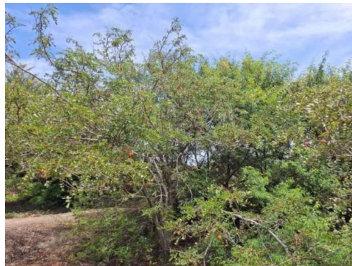
Fotografía 4: Árboles de tara para poda