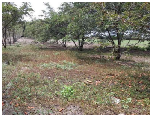
Fotografía 5: Parcela de Tara 1 Ha