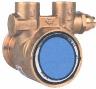
Bomba de refuerzo para equipo de ósmosis