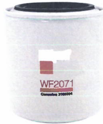
Filtro de Agua