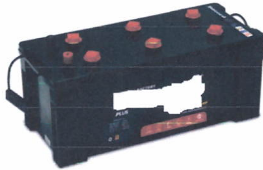
Batería de 23 placas