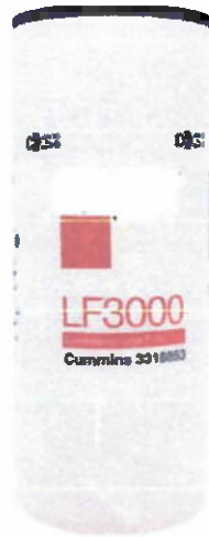
Filtro de Aceite