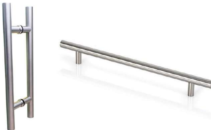
Imagen N°03: Imagen Referencial