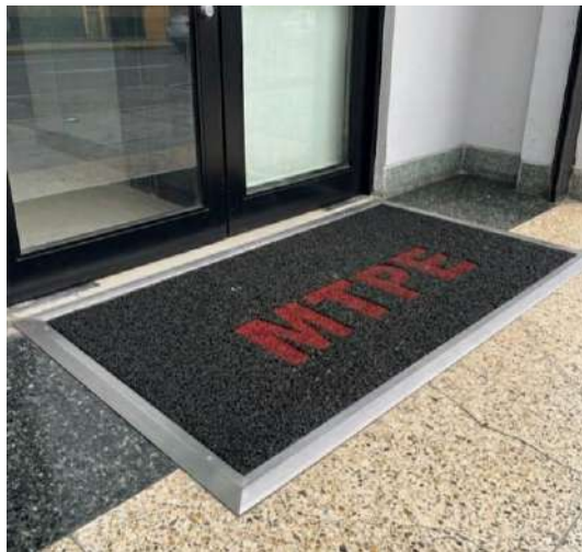
Imagen N°07: Imagen Referencial de la alfombra

aluminio para aprobación de la Entidad. El área de trabajo deberá quedar libre de residuos de pegamento o polvo tras la instalación.