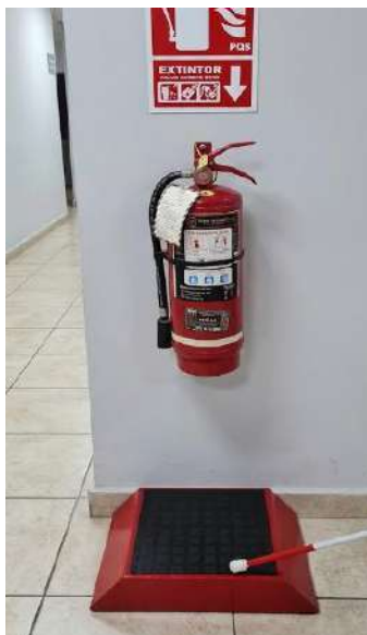
Imagen N°04: Imagen Referencial