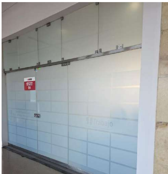
Imagen Referencial de la señalética