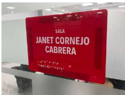
Imagen N°05: Imagen Referencial de la señalética