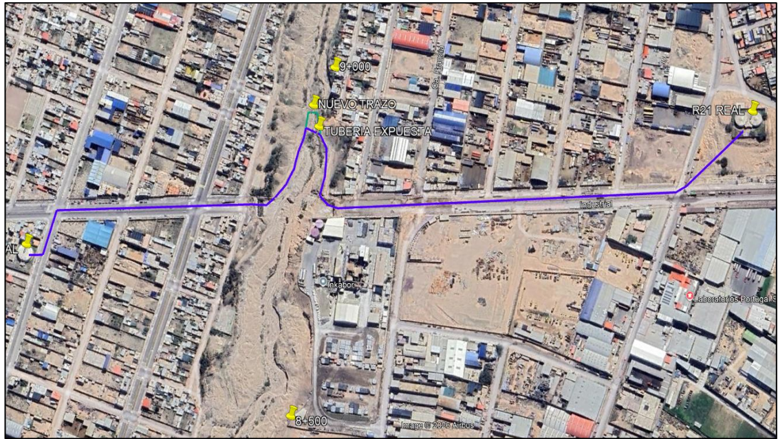
Ilustración 1: Ámbito del proyecto