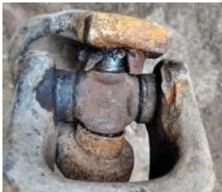
Imagen 3. Estado actual del cardan de la picadora de dos líneas M-TWIN

Firmado digitalmente por: QUILCATE PAIRAZAMÁN Carlos Enrique FAU 20131365994 soft Motivo: En señal de conformidad Fecha: 30/03/2026 12:52:52-0500