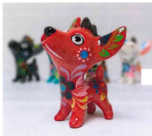
Perro peruano parado