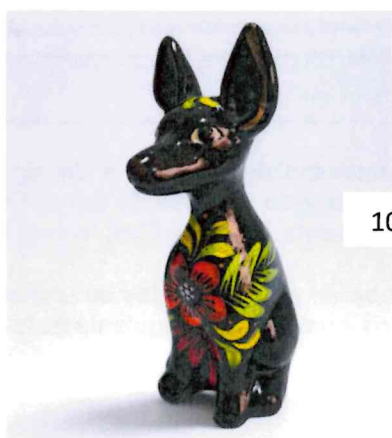
Perro peruano sentado