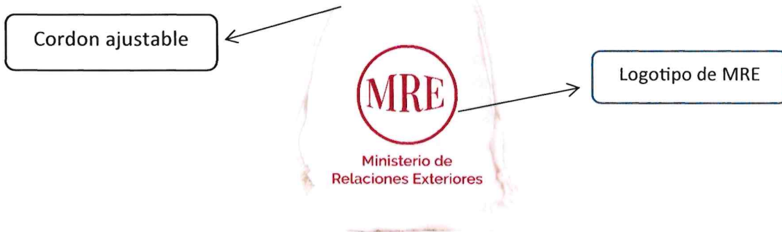
Imagen referencial de etiqueta descriptiva: