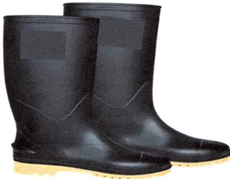
IMAGEN N° 01: BOTAS SANITARIAS PVC.