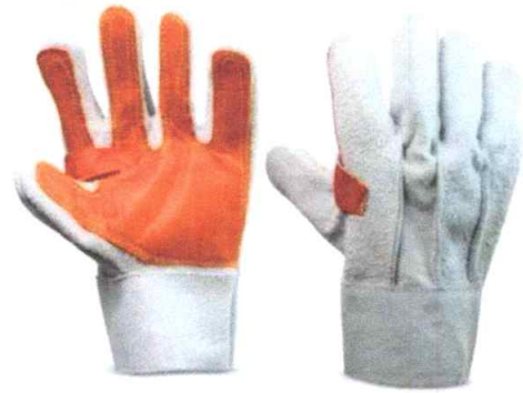
IMAGEN N° 02: GUANTE DE CUERO CON PALMA REFORZADO.