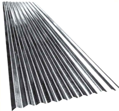
IMAGEN N° 01: CALAMINAS DE ACERO.