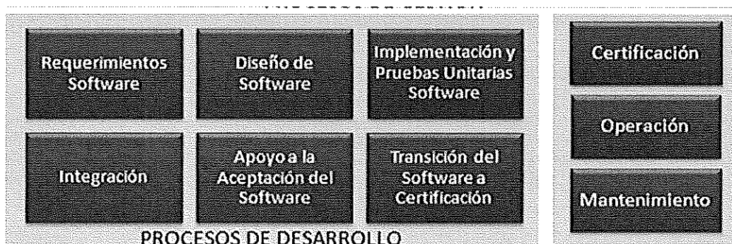
Ilustración. Metodología para el Ciclo de Vida del Software - BN

Los procesos principales de la "Metodología para el Ciclo de Vida del Software" son los que a continuación se grafican: