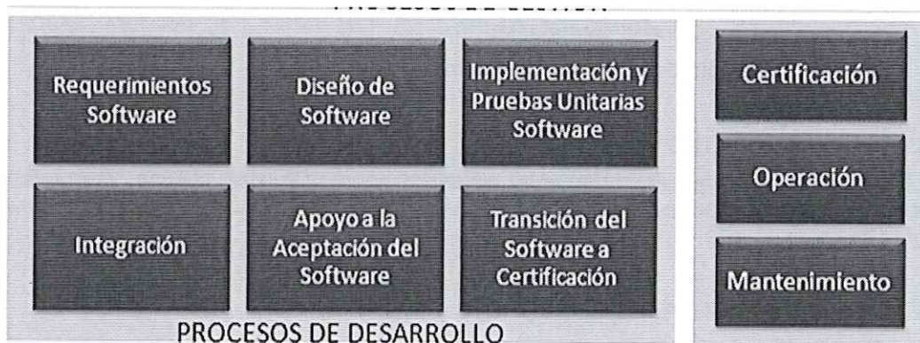
Ilustración. Metodología para el Ciclo de Vida del Software - BN

Los procesos principales de la "Metodología para el Ciclo de Vida del Software" son los que a continuación se grafican: