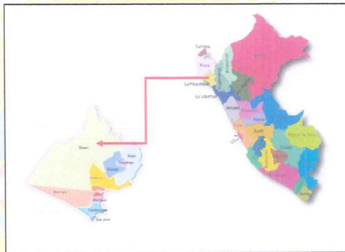
Ubicación Política del distrito de Olmos.