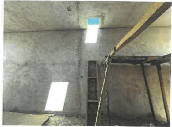
Ubicación propuesta de medidores de caudal al interior de la cámara