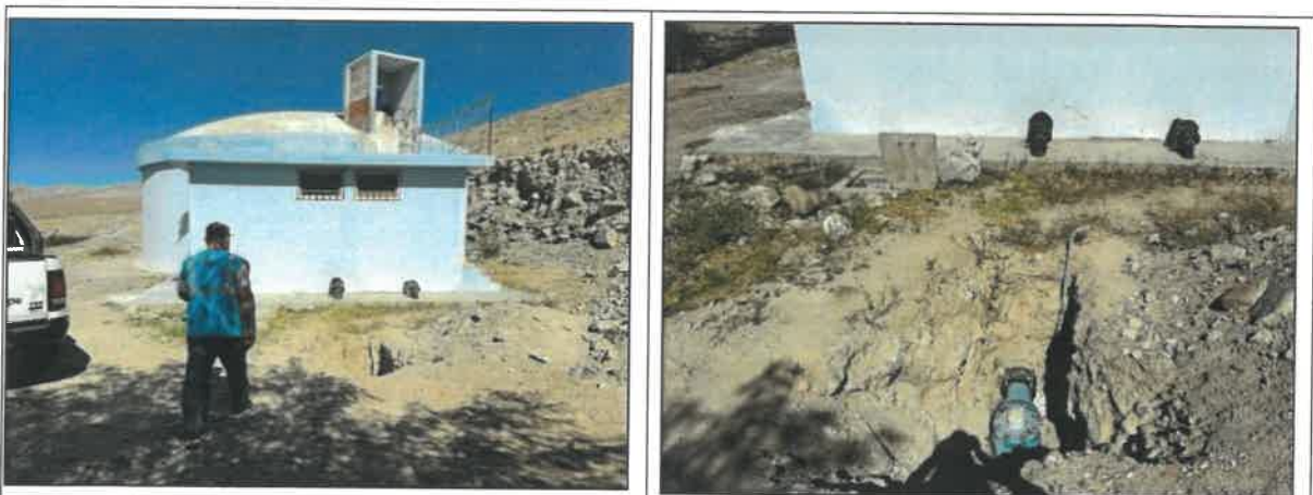
Ubicación propuesta de medidores de caudal al interior de la cámara

Se instalará el tablero eléctrico en la cámara de válvulas. No se tiene planos de ubicación, por lo tanto, se muestra fotos de la posible ubicación del tablero.