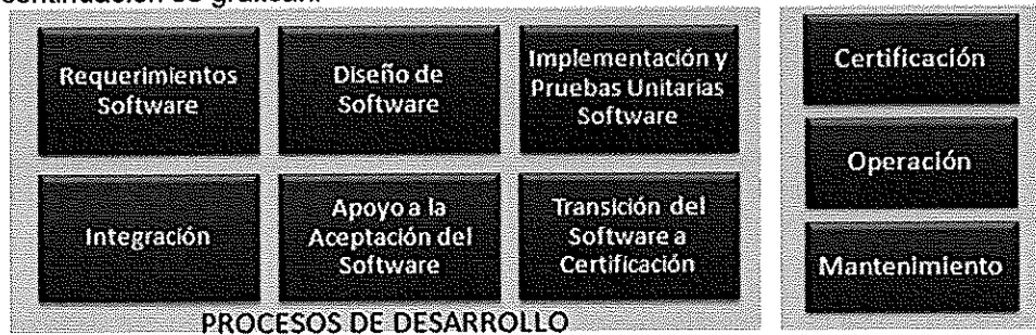
Ilustración. Metodología para el Ciclo de Vida del Software - BN

Los procesos principales de la "Metodología para el Ciclo de Vida del Software" son los que a continuación se grafican: