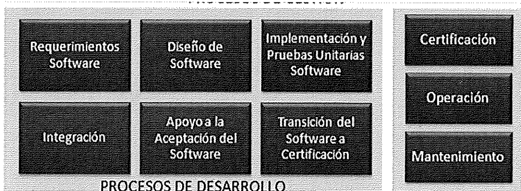
Ilustración. Metodología para el Ciclo de Vida del Software - BN

Los procesos principales de la "Metodología para el Ciclo de Vida del Software" son los que a continuación se grafican: