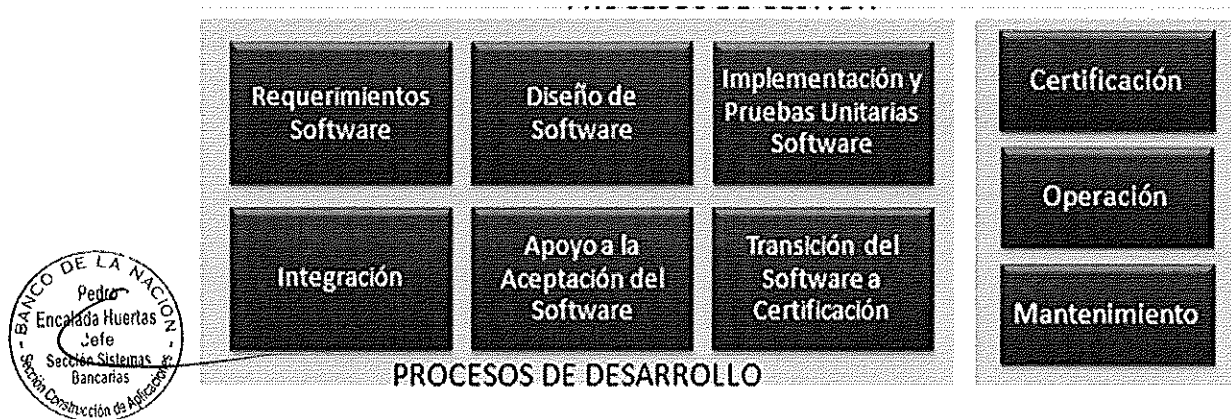
Ilustración. Metodología para el Ciclo de Vida del Software - BN

Los procesos principales de la "Metodología para el Ciclo de Vida del Software" son los que a continuación se grafican: