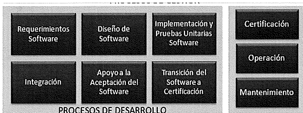
Ilustración. Metodología para el Ciclo de Vida del Software - BN

Los procesos principales de la "Metodología para el Ciclo de Vida del Software" son los que a continuación se grafican: