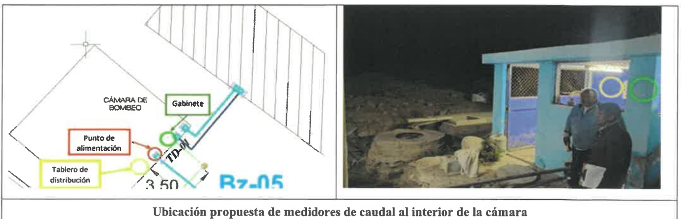
Ubicación propuesta de medidores de caudal al interior de la cámara

Se instalará el tablero eléctrico y el gabinete 8RU en la cámara de bombeo. La energía eléctrica se tomará de un tablero general, de este punto se alimentará el tablero y el gabinete.